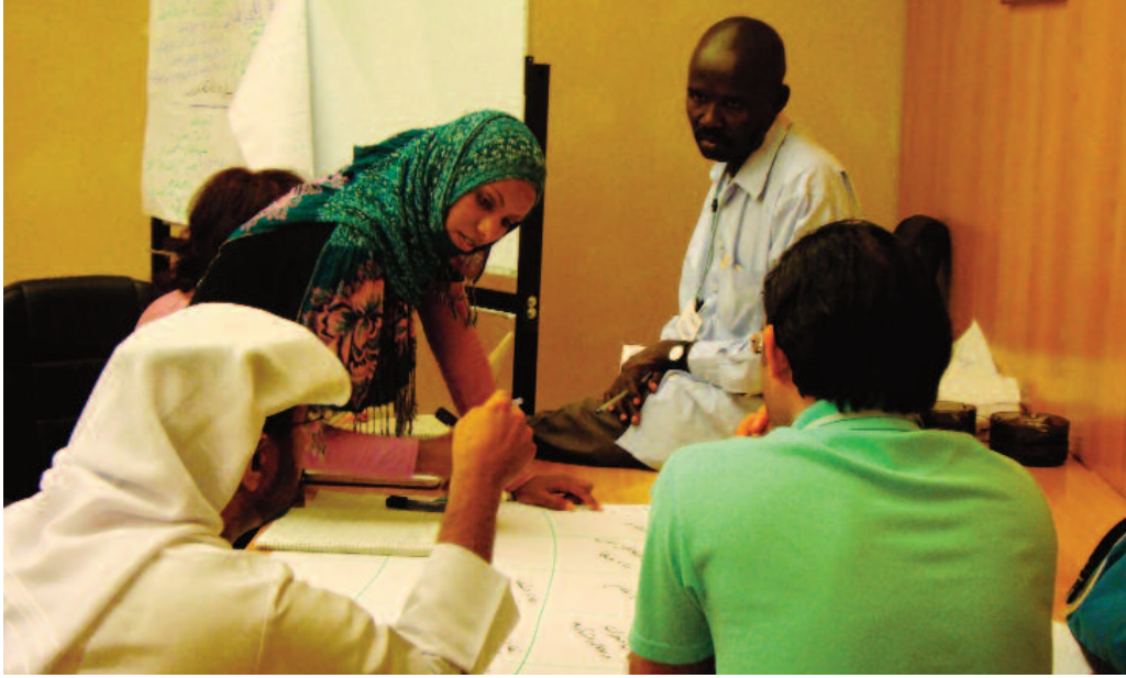
Bir güvenlik eğitimi sırasında katılımcılar Aktör Analizi üzerinde çalışıyor

Bu bölümde bağlam analizinin neden faydalı olduğunu, kiminle ve ne zaman yapılması gerektiğini inceleyeceğiz. Bağlam analizi için iki araç tanıtacağız – Bağlam Analizi Sorular ve Aktörlerin Analizi. Ek -1’de ise daha basit bir araç bulabilirsiniz: SWOT (Güçlü yönler, zayıf yönler, fırsatlar ve tehditler) Analizi.